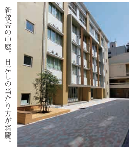
新校舎の中庭。日差しの当たり方が綺麗。