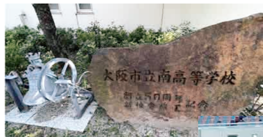
南高校旧校舎からの「石碑」と「まごころの鐘」の移動。新しく新校舎に落ち着きました。

コロナ禍で活動の幅が狭まった数年。その中でも最後の思い出を作ろうと開催された定期演奏会など。感慨深いものがあります。もっと写真載せたいものがあります。